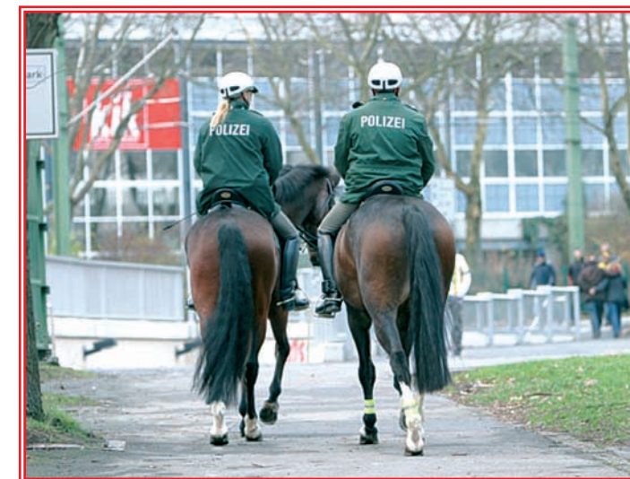
Polizei-Reiterstaffel